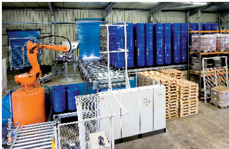
Ein Knickarm-Roboter bedient die Fassfüllautomaten mit Leerfässern.

Für die Verbundbefüllung können Leerfässer manuell auf Chemiepaletten gestellt werden. Die Anordnung der Spundlöcher ist dann undefiniert. Kamerasysteme mit Bildauswertungssoftware ermitteln ihre Mittelpunkte; auf dieser Basis werden die Werkzeuge des Automaten nacheinander positioniert. Eine Parallelbearbeitung wie bei der automatischen Einzelbefüllung ist nicht möglich. Die Summe des Zeitbedarfs aller nacheinander ausgeführten Arbeitsvorgänge bestimmt also die Ausbringung.